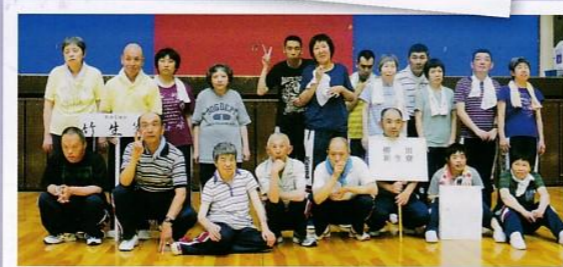
暑い中おつかれさまでした!