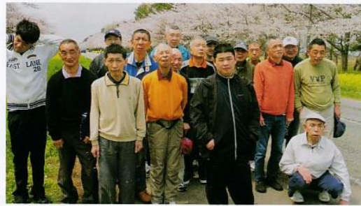
桜と菜の花がキレイに咲いていました!