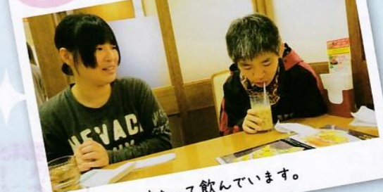
味わって飲んでいます。