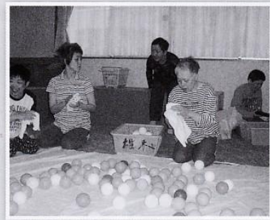
きれいに磨いています。

ふきのとうで使用していた送迎車の老朽化に伴い、中央競馬馬主社会福祉財団様より助成金を頂き、新しく送迎用リフト付きワゴン車を一台購入させていただきました。新しい車で送迎出来、助かっています。大切に使用させていただきます。ありがとうございます。