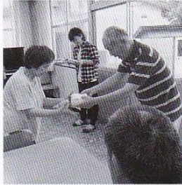
毎月、誕生日の方へプレゼントをしています。

平成29年度のあおぞら会の活動として、その月の誕生者の方へのプレゼントを継続して行っています。そして毎月行う朝のつどいでは、皆さんの意見や要望を聞き、日常生活に取り入れるようにしています。また、利用者さんと職員で「私たちも参加しよう共同募金」への参加も考えています。空き缶の回収と分別活動も継続していきます。利用者さんが楽しみながら竹生寮での生活を送れるようこれからもあおぞら会として活動していきたいと考えています。