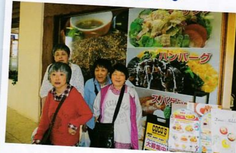
ココスで満喫。楽しんできました!