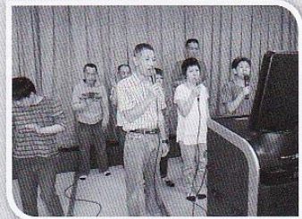
3人で仲良く歌います。盛り上がりました。