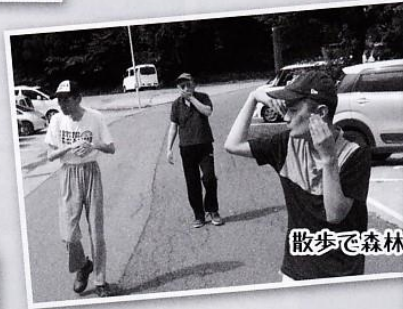
散歩で森林浴しています。