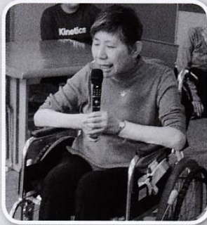
みんなでカラオケを楽しみました。