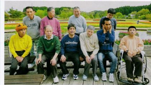
チューリップの前でパチリ!