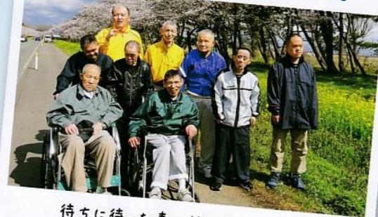
待ちに待った春のドライブです。