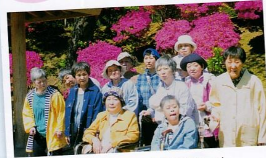
千秋公園のつつじ見頃でした!