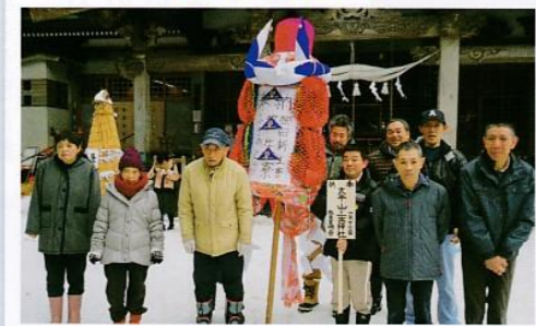
無事に奉納してきました。