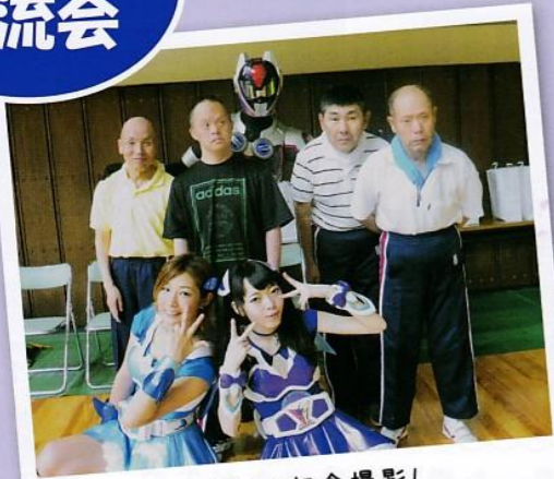
アイドルと記念撮影!