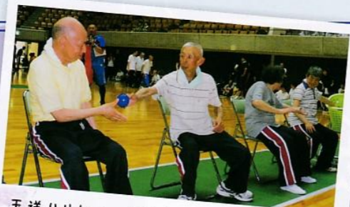
玉送りリレー、力を合わせて頑張りました!