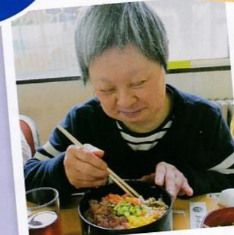
ちらし寿司いただきます。