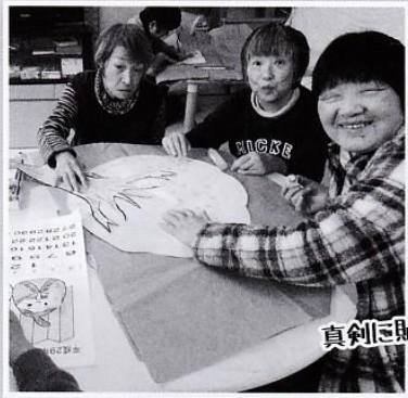
真剣に貼っています。