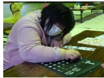
カレンダーにシールを貼ったり スタンプを押したりしました☆

訓練棟内でもソーシャルディスタンスを保ち、途中で手洗い・うがいの時間を設ける等皆さんにご協力いただけたことで開催することができました。