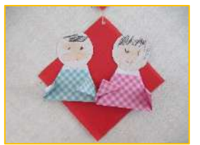
外来療育の利用児が作ったお雛様