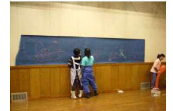
BGMを聞きながら、黒板いっぱいに描いていきます！！