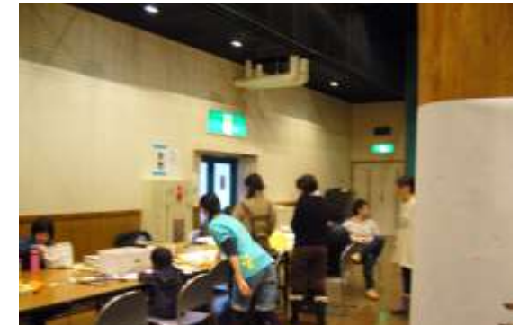
表現方法はさまざま！どんなアートが飛び出すかな☆☆